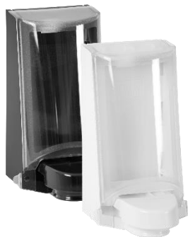
Tuote no. 4552 / 4551