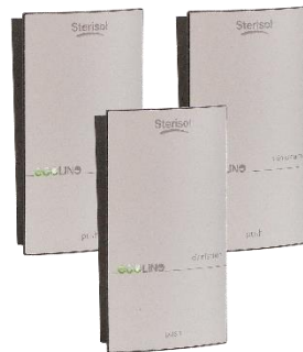
Tuote no. 1530 / 1533 / 1536